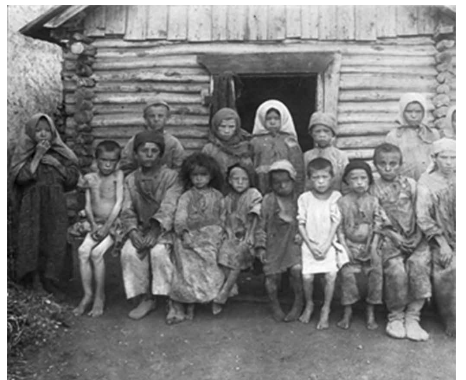
Дети питаются хуже, чем скот у хозяина. Фото 1887 года