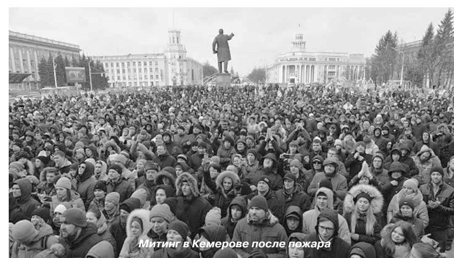
Митинг в Кемерове после пожара

очередную массовую гибель людей, вкачать в сознание живых по-настоящему мощную анестезию, чтобы предотвратить болезненное ломку, продлить мгновение. Чудовищное для людей, но прекрасное для себя. Капитал универсален. Его инстинкты не связаны с географией, культурой и вероисповеданием. Пожар на фабрике Трайэнгл в Нью-Йорке в 1911 не отличается от пожара на текстильной фабрике в Бангладеш в 2012. Это можно делать долго. Но это нельзя делать бесконечно. Рано или поздно причинно-следственные связи, объединяющие все трагедии, станут мучительно очевидными. Да, капитализм убивает. И буквально, и фигурально. И в этом убийстве, в расчленении человека, в его овеществлении в равной степени участвуют и собственник торгового центра, и собственник охранного предприятия, и собственник кинотеатра, и собственник прокатной конторы, которая поставила кинотеатру похабный детский мультфильм. Капитализм убивает. Визажные охранительской своры, требующей карать коммунистов и «не пиариться на чужом горе», выглядят, в действительности, самым бесстыдным глумлением. Потому что приводящиеся сегодня в пример катастрофы советского времени на миллиметр не похожи на трагический марфон, в котором мы участвуем с 1991-го года. Потому что: — катастрофы советского времени не были вызваны жадностью, — они не происходили с такой чудовищной, монотонной регулярностью.