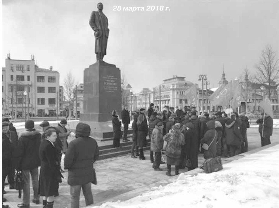
28 марта 2018 г.

нашей стране. Но по телевизору ни до 28 марта, ни 28 марта не было сказано ни одного слова, ни по одному каналу. Лишь «Культура» показала старый 1938 года фильм «Детство» и «В людях», ничего фактически не сказав о его авторе. Конечно, можно сослаться на ту беду, которая случилась в Кемерово, и в связи с ней 28 марта стал днём траура для всей России, но обычно к юбилею готовятся заранее и о нём трубят задолго до дня юбилея. Так могло быть и на этот раз, когда никто и подумать не мог о той страшной трагедии, что случилась в Кемерово.