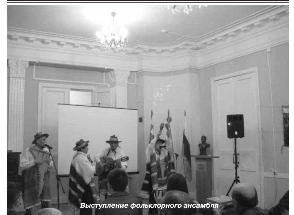
Выступление фольклорного ансамбля

Ранее «Российский Диалог» сообщал об условиях начала диалога между РПЦ и непризнанной УПЦ. Также стало известно о намерении Русской православной церкви освятить воды Мирового океана.