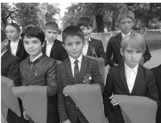
19 мая, пионеры села имени Коста Хетагурова — маленькое горное интернациональное село в Карачаево-Черкесии. Там всего одна школа, но в ней 70 пионеров! В этот день пионеры проводили конкурс песни, строя. Пели, как в советские времена, пионерские песни. Их матери, одетые в национальные костюмы подпевали своим ребятам. Все они были раньше пионерками.