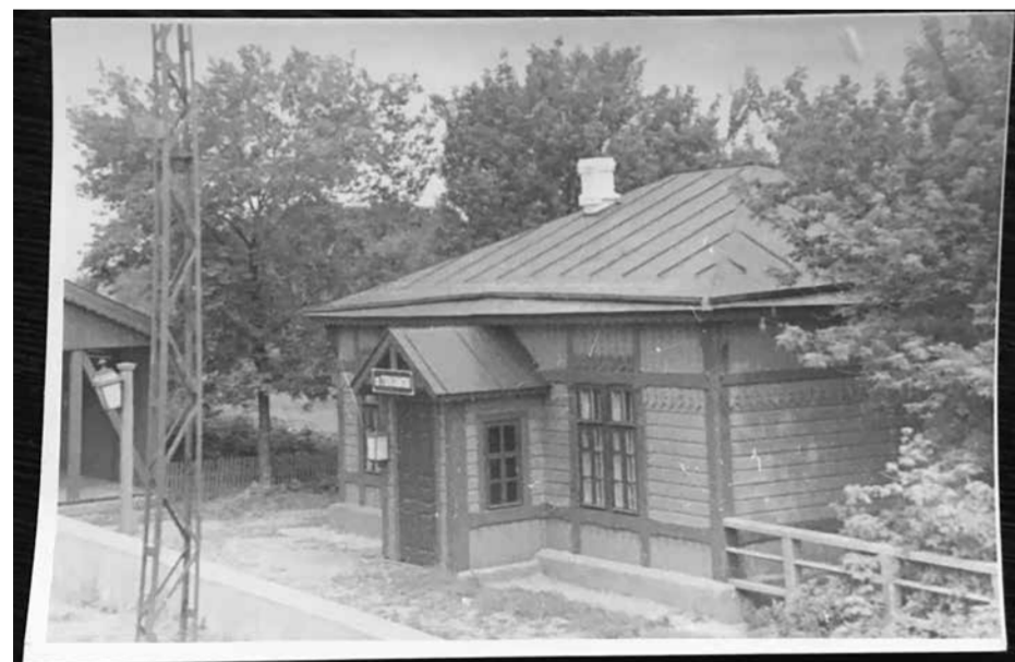
Несохраненный вокзал тогдашней станции Герасимовская, откуда отошёл траурный поезд

Крестьянство, бедное и бесправное, в своём большинстве находившееся на грани голода, остро хотело земли; и, не в меньшей мере — демократические свободы. Социализм им был в это время чужд, а российский пролетариат — ещё слаб, что вести за собой в социализм крестьянскую массу. Ситуация в России была совершенно иная, чем в Европе. Многочисленное (более 10 миллионов человек) крестьянство, втянутое в товарный обмен, уже начинало разлагаться на батраков и сельскую буржуазию, но ещё сохраняло и патриархальные, общинные пережитки. Около 10 миллионов рабочих были связаны с землёй или включены в ремесленное, по сути докапиталистическое, производство и являлись фактически полупролетариями. Только около миллиона рабочих представляли потомственный пролетариат крупного машинного производства — «природного носителя социализма» по словам Энгельса. Вести за собой такую массу можно было лишь одним способом — удовлетворяя её насущные потребности. А они в малой степени были тогда социалистическими; патриархальный коммунизм, на который