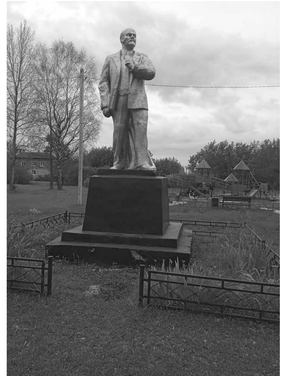
Памятник находится в поселке Тугалеский Бор Шатурского района Московской области

Памятник В.И. Ленину у Ярославского вокзала более 20 лет привлекал пассажиров мероприятиями по распространению коммунистической прессы. Власти делали все, чтоб прекратить митинги, а затем и пикеты, ссылаясь на опасную зону железной дороги, которая находится, однако, более чем в 100 метрах. Однако пикетчики все таки добились от городских властей приведения памятника в надлежащий вид.