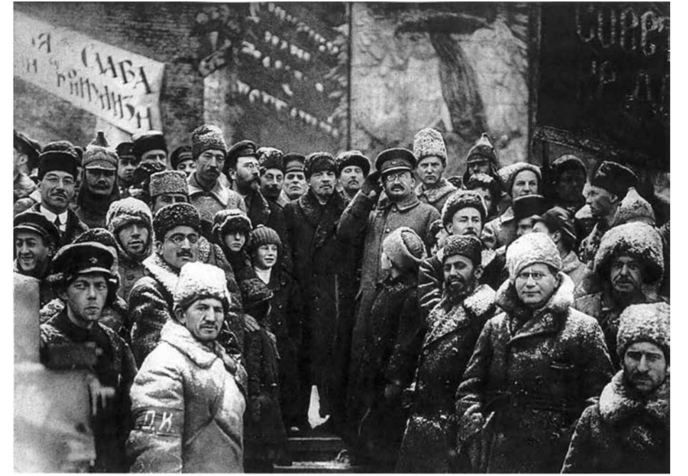
1919 год. Ленин во вторую годовщину Октябрьской революции

Поэтому одной из главных задач коммунистов является разьяснение высшим отрядам рабочего класса (в том числе среди учёных, занятых в материальном производстве) их истинного классового положения, а коммунистическим теоретикам — разработку методов измерения (и, соответственно, повышения) уровня культуры рабочего класса. А пока эти слои рабочего класса (сейчас весьма многочисленные) находятся под