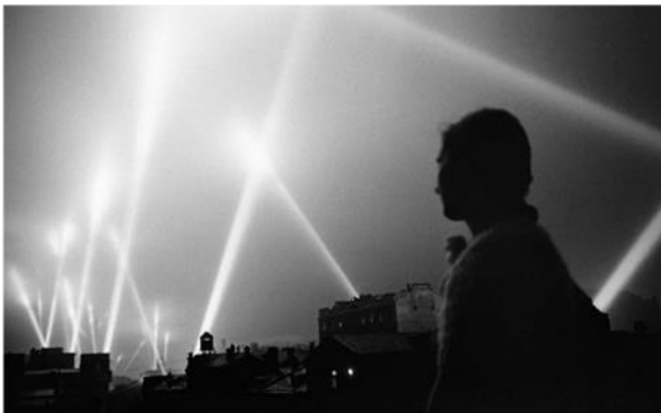
Лучи прожекторов войск ПВО освещают небо Москвы, июнь 1941 года

Те, кто стремятся изменить или игнорировать историю, не только навязывают другим (в данном случае Советскому Союзу) отрицательный заряд, но и демонстрируют избирательную память с целью рассеивания своих собственных действий, по крайней мере, сомнительных.