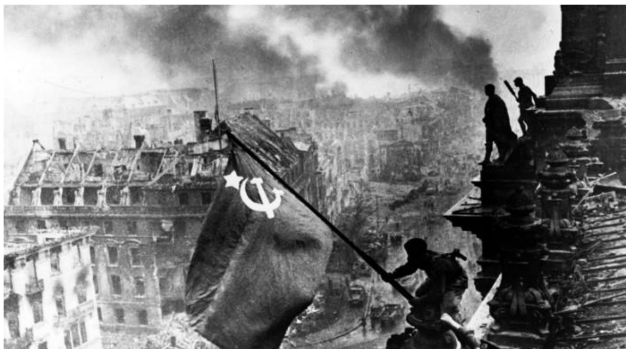
«Знамя победы над Рейхстагом», фото сделано 2 мая 1945 г.

Истина была призвана быть основным признаком современности. Должны были уйти в прошлое суеверия и средневековое мракобесие. Мы подходили к светлым временам, где факты могли быть проверены эмпирическим методом. Мятеж и обман заслуживали христианского погребения и превратиться в плохое воспоминание о прошедшей эпохе. Но амбиции капиталистической системы похоронили идею исторической правды.