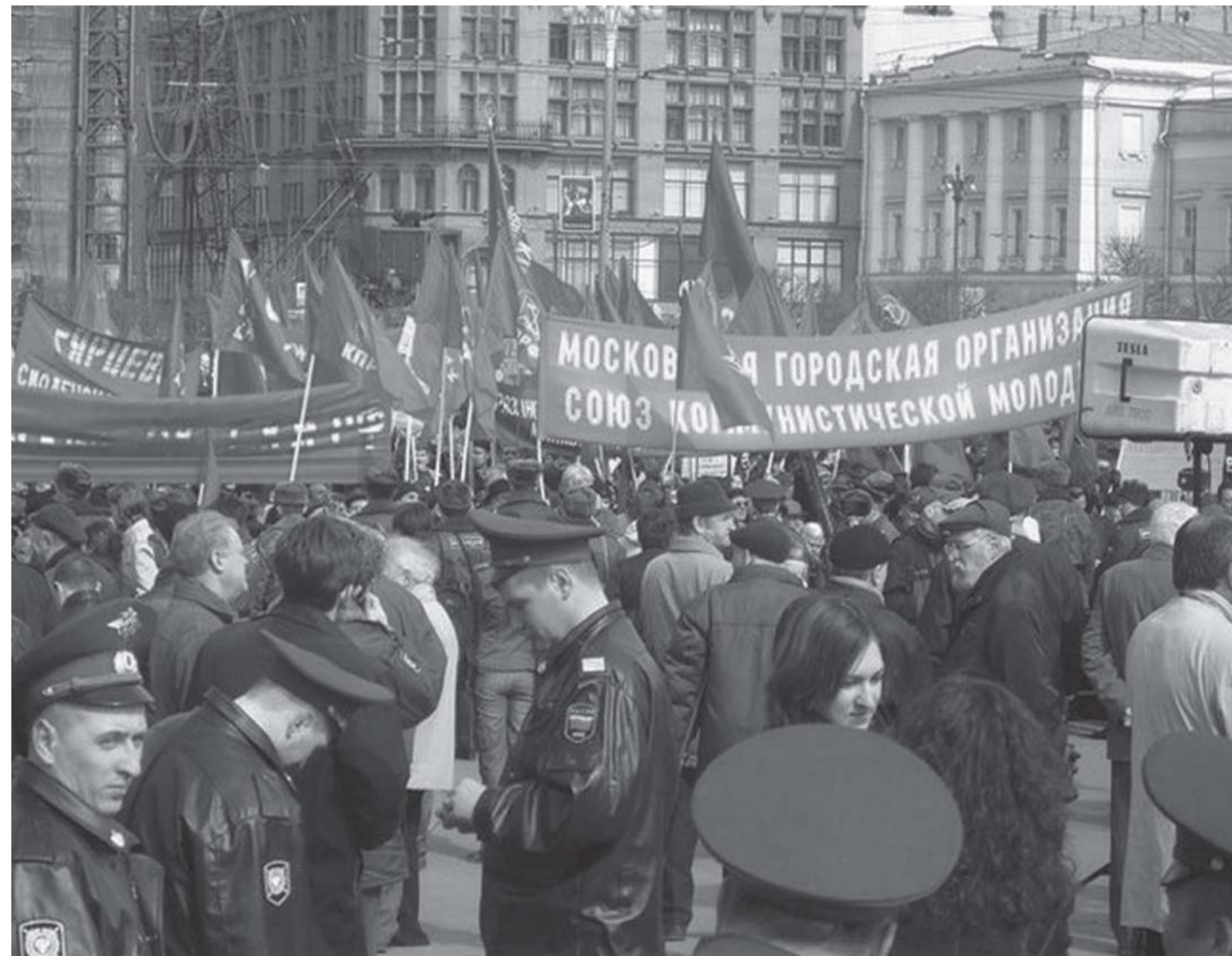
Москва, Театральная площадь, 8 апреля. Акции протеста нарастают.