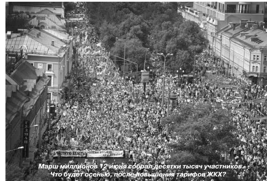
Марш миллионов 12 июня собрал десятки тысяч участников. Что будет осенью, после повышения тарифов ЖКХ?