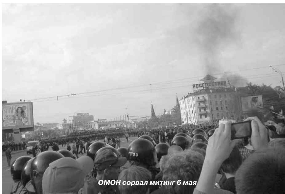
ОМОН сорвал митинг 6 мая

Это путь спасения России от неминуемой общенациональной катастрофы. Путь из России путинской к России социалистической.