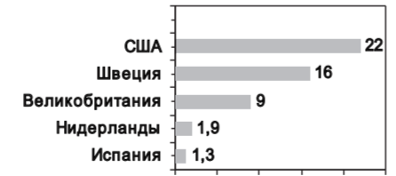
ДИАГРАММА 2. СРЕДНЯЯ СТОИМОСТЬ УЧЕБЫ В ГОД, В ТЫС. ЕВРО

Но только ли забота о трудоустройстве выпускников университетов так печалит американских пропагандистов, что они готовы пожертвовать доходами своих университетов, в которых обучаются студенты со всего мира (при плате за обучение отнюдь не символической -см. диаграмму 2)? Не заботит ли их то, что эффективность американской системы обучения не так высока, и что в условиях надвигающегося кризиса им гораздо выгоднее опустить количество и качество специалистов в странах-конкурентах, чем повысить качество образования в США? За границами США тоже умеют считать деньги, и не случайно, что среди сотрудников транснациональной корпорации «Самсунг» 80% имеют университетское образование, при этом эта южнокорейская компания теснит на рынках продукции безмерное рекламируемой американской компанией «Эппл».