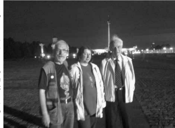
22 июня 2015 года. После антифашистской акции «1418 свечей» на Поклонной горе