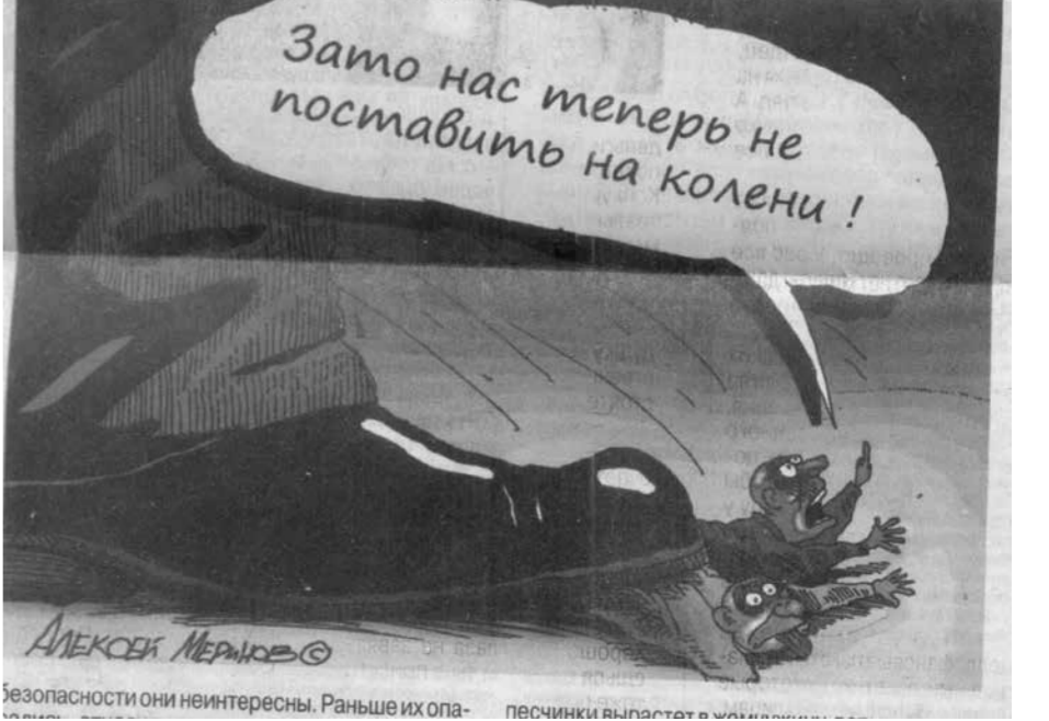
Безопасности они неинтересны. Раньше их оп... песчинки выпадут...

У этого теста есть ещё картинка банана с нумерацией той же , что в описании.