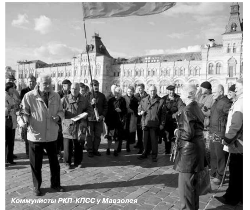
Коммунисты РКП-КПСС у Мавзолея