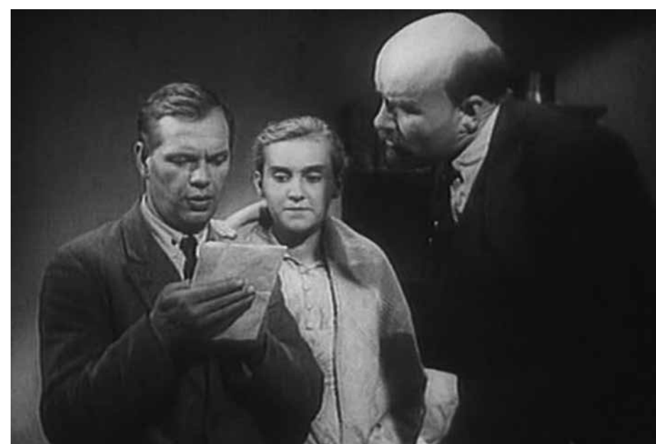
Кадры из фильмов «Ленин в Октябре» и «Человек с ружьём»