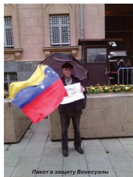
Пикет в защиту Венесуэлы

Мун не может усидеть сразу на двух стульях. Он не может укрепить союз Южной Кореи с США и в то же время надеяться на улучшение отношений между Севером и Югом. Альянс США-Южная Корея возник в рамках Договора о взаимной обороне 1953 г., заключенного в нарушении Договора о перемирии, заключенного после Корейской войны. Статья IV(60) Договора о перемирии гласит, что в течение трех месяцев после его подписания (в 1953) должна быть проведена политическая конференция «для урегулирования путем переговоров вопросов о выводе всех иностранных войск из Кореи и мирного урегулирования корейского вопроса». Перемирие также требует от всех сторон «прекратить ввоз в Корею подкреплений в