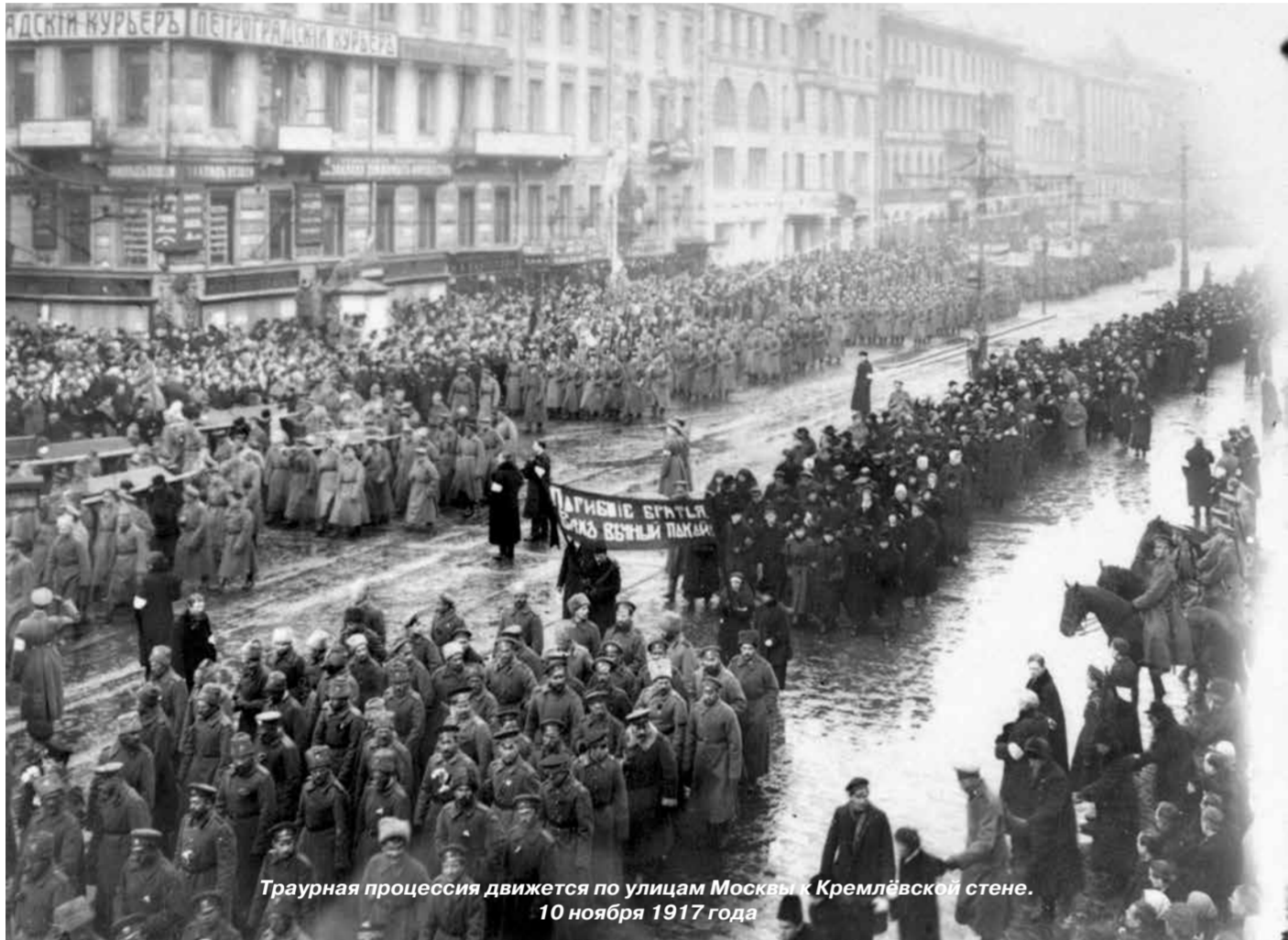
Траурная процессия движется по улицам Москвы к Кремлевской стене. 10 ноября 1917 года