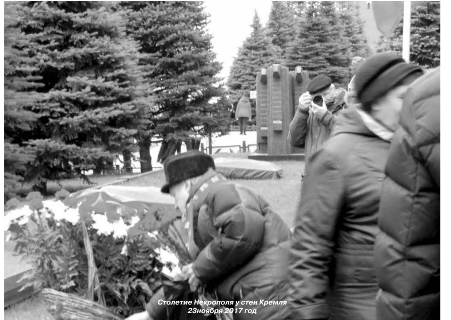
Столетие Некрополя у стен Кремля 23 ноября 2017 год