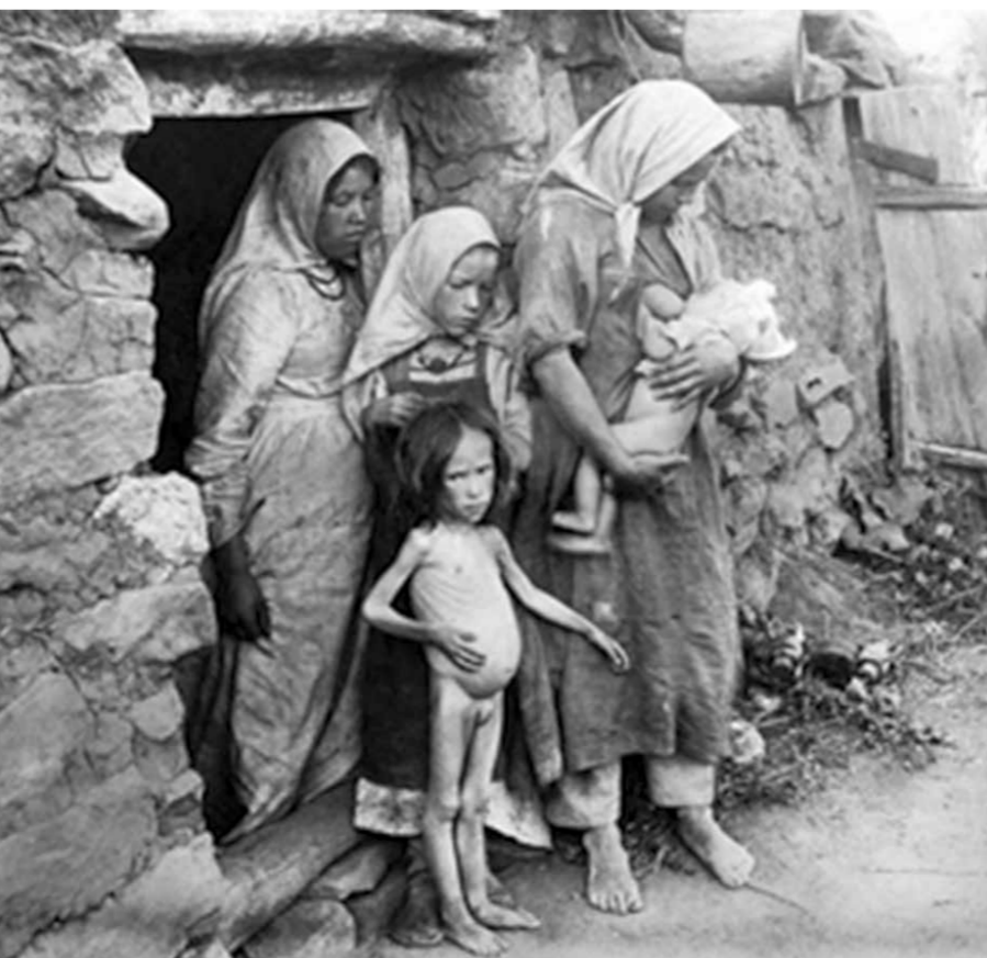
Дети питаются хуже, чем скот у хозяйна. Фото 1887 года

Автор немного ошибся. «Эпизодом» она была далеко не третьим. Задолго до начала английской революции, 74 года назад в 1566 г. была еще и нидерландская революция, а была еще война